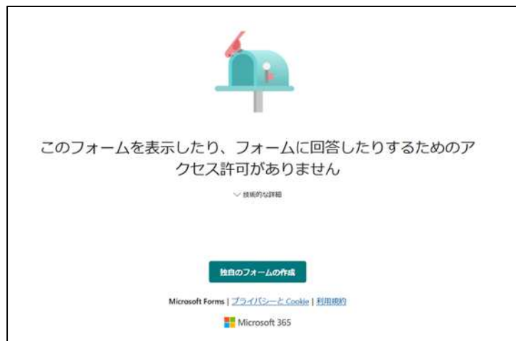
エラー発生時の画面